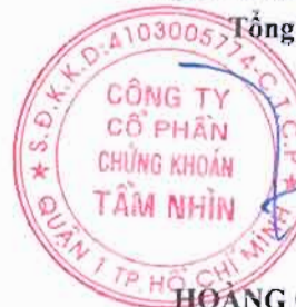
HỒNG QUỐC HÙNG